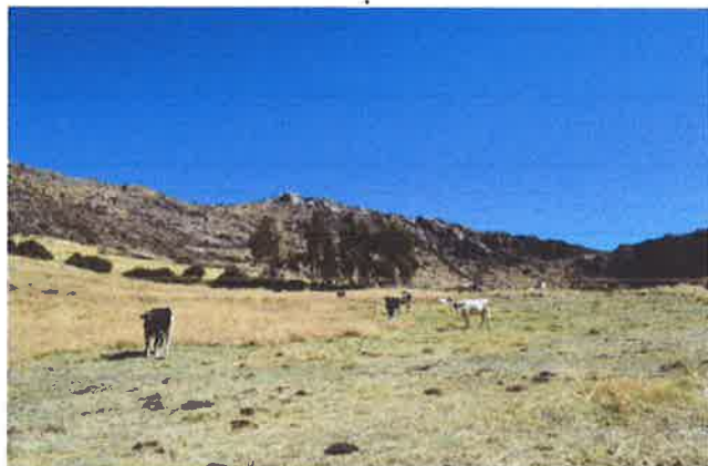
LOS POBLADORES DE SOQUESANE TIENEN A LA GANADERIA COMO OTRA DE SUS ACTIVIDADES ECONOMICAS.