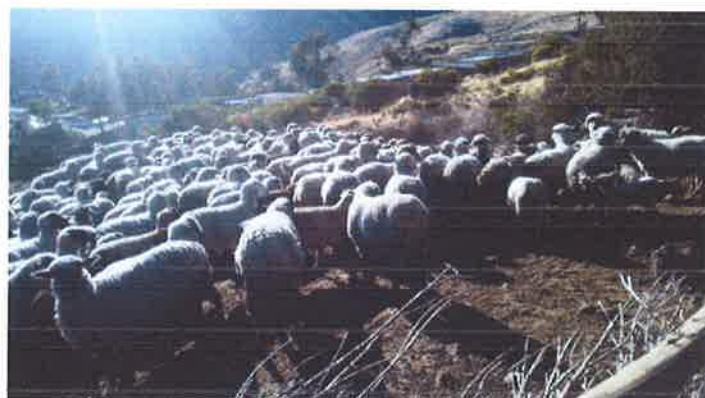
LA CRIANZA DEL GANADO OVINO ES OTRA DE LAS ACTIVIDADES ECONÓMICAS AFECTADAS POR LAS BAJAS TEMPERATURAS.