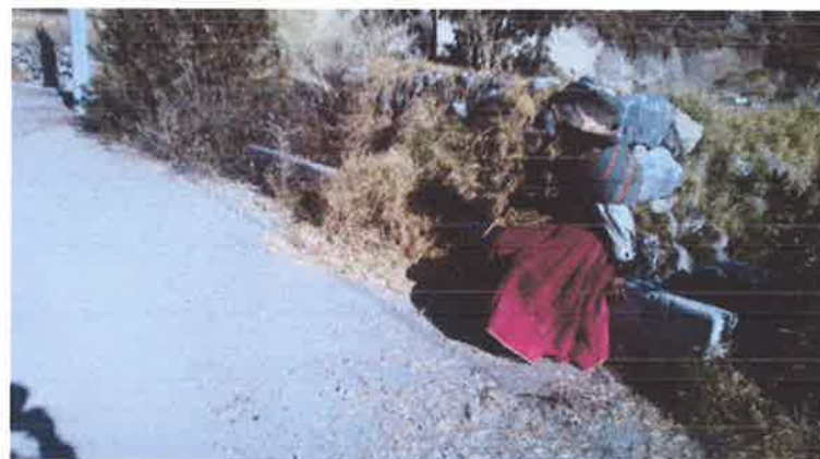
LA POBLACION ADULTA Y MENORES DE EDAD SON MAS PROPENSOS A CONTRAER ENFERMEDADES RESPIRATORIAS AGUDAS (IRAS).