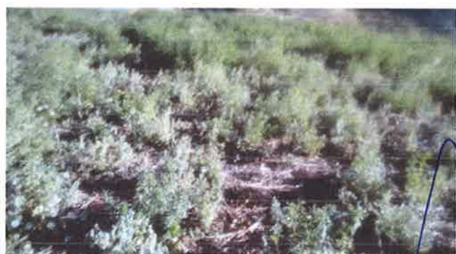
LOS CULTIVOS DE ALFALFA HAN SIDO AFECTADOS POR LAS HELADAS.