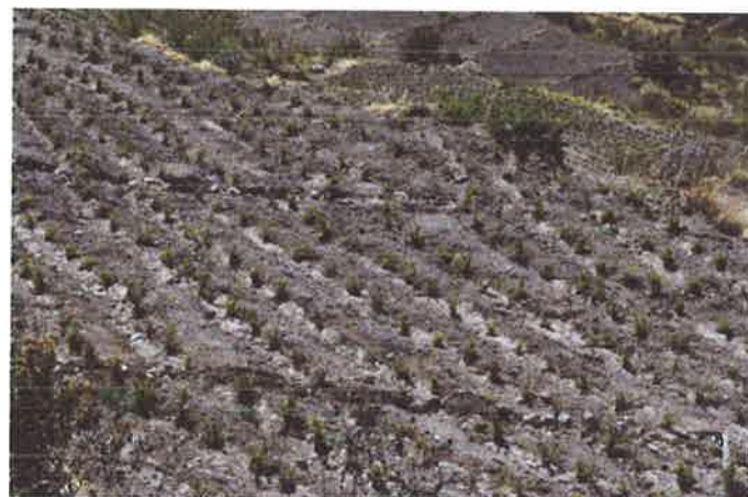
CULTIVOS DE OREGA EN EL ANEXO DE SOQUESANE TAMBIEN FUERON AFECTADOS POR LAS HELADAS.