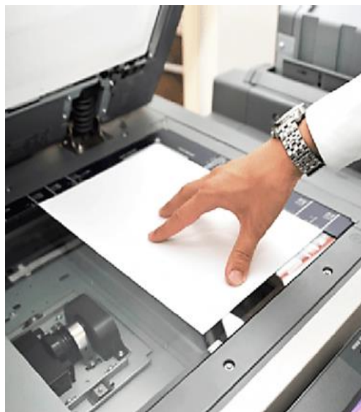
Fotocopiadora Bizhub 542, 572